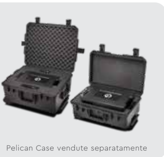
Pelican Case vendute separatamente

Hardware RAID trasportabile Soluzione di storage Thunderbolt con 8 alloggiamenti