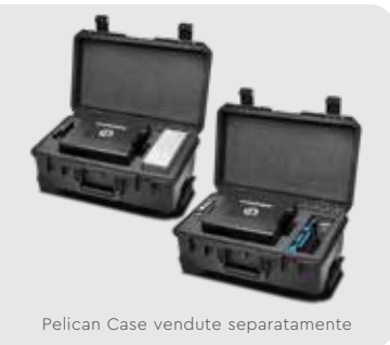
Pelican Case vendute separatamente